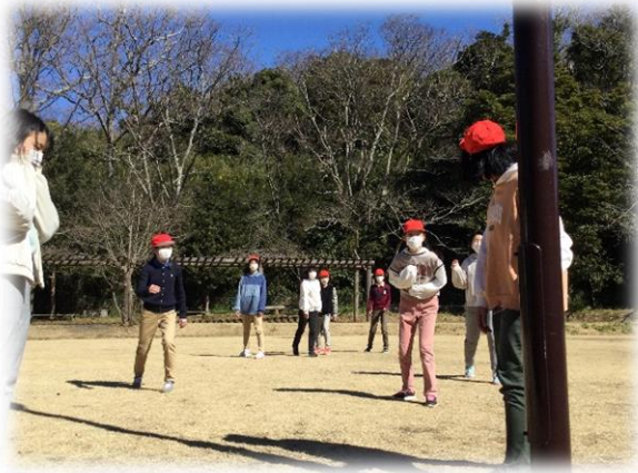
だるまさんがころんだ

自然教室で一日何をしても良い日。 自分達で計画を立てて、いろいろな活動をして楽しみました。 自然教室にあるものを存分に生かして上手に計画できたのは、 清泉小学校で6年間過ごしたからこそです。