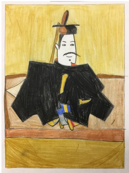
児童が描いた源頼朝