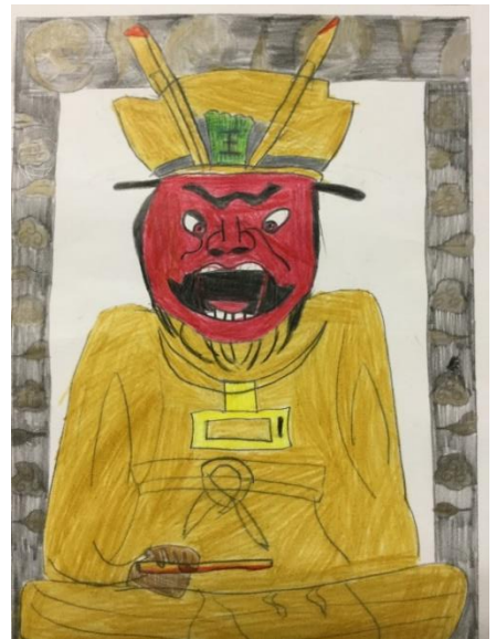
児童が描いた閻魔様