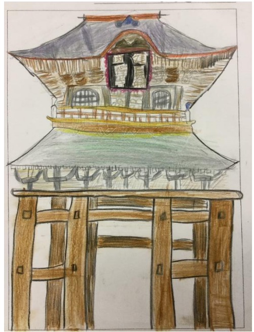
児童が描いた山門