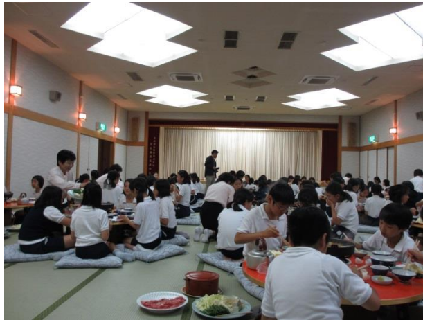
2日目の夜のすき焼き。お腹いっぱい食べました。 ホテルの方の温かいお心遣いに感激しました。