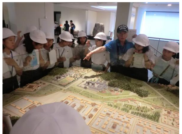
最後の見学地は飛鳥資料館でした。 テーマをしばって、調べ学習をしました。