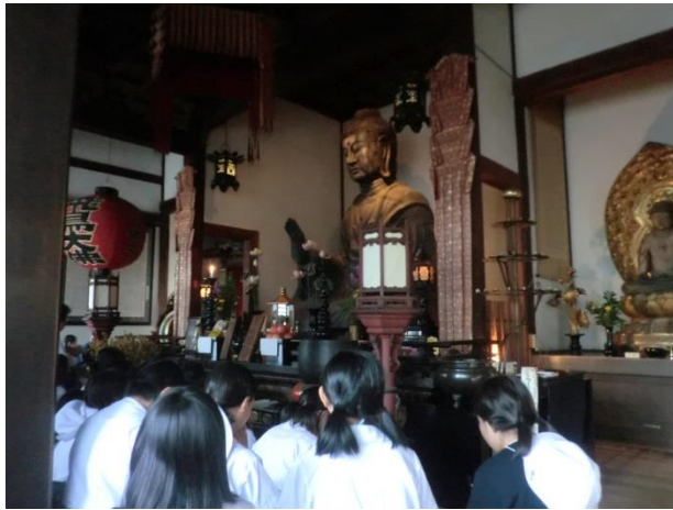
飛鳥寺では、お寺の方のお話に耳を傾けました。